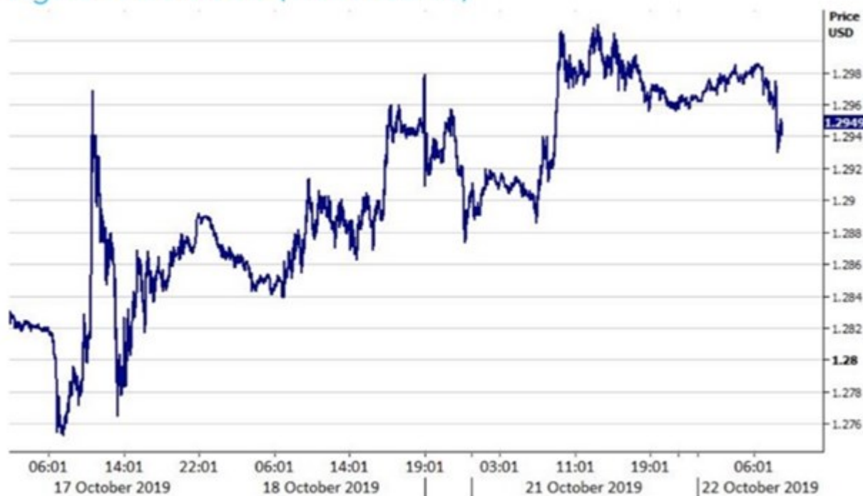
Figure 1: GBP/USD (17/10 -22/10)

Date: 22/10/2019