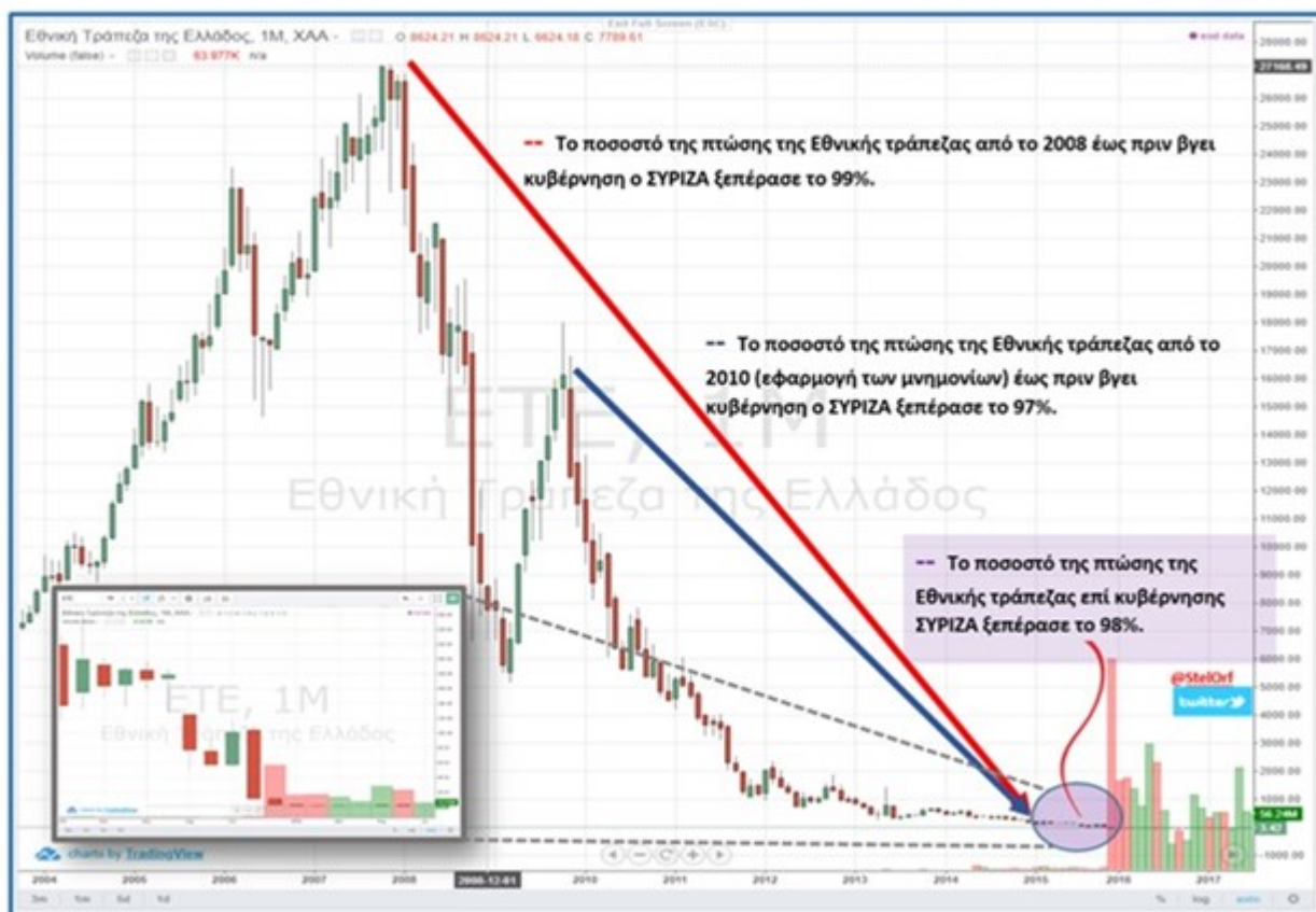
ΓΡΑΦΗΜΑ 3: Η χρηματιστηριακή κατάρρευση της Εθνικής τράπεζας από το 2008 έως σήμερα. [ < 2010-2014 > πτώση μεγαλύτερη του 97%, < 2015-σήμερα > πτώση μεγαλύτερη του 98%]